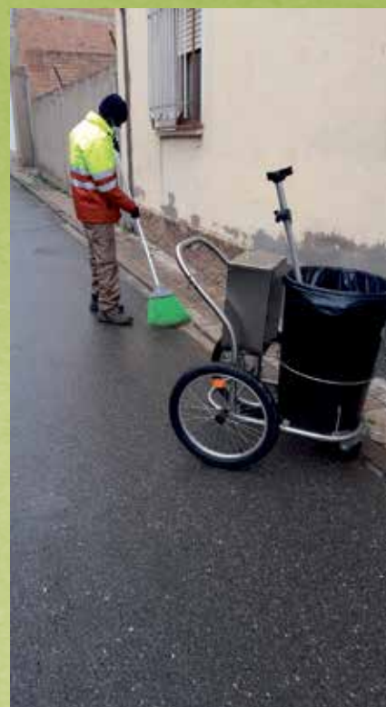
La limpieza viaria es uno de los trabajos que más personal precisa

Otras mejoras han sido la aportación de una barredora de bajas emisiones sonoras, así como de tres vehículos eléctricos para el servicio, medidas para fomento de la conciliación -se sigue avanzando en la línea iniciada en la anterior licitación, ya que la empresa se compromete a permisos para tutorías para los trabajadores- y compromiso para la contratación de peones extras de refuerzo para los meses del verano (julio y agosto) durante toda la vigencia del contrato.