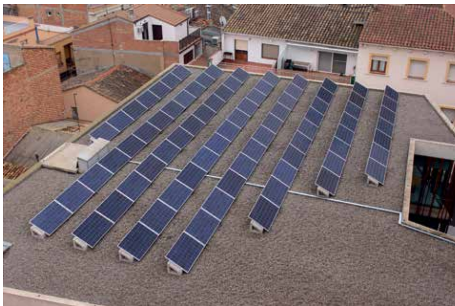
El Ayuntamiento seguirá invirtiendo en placas fotovoltaicas