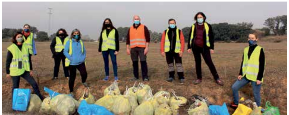
Los voluntarios posan con la basura recogida

Esta acción se desarrolló en colaboración con el Proyecto Libera y se ciñó a volun-