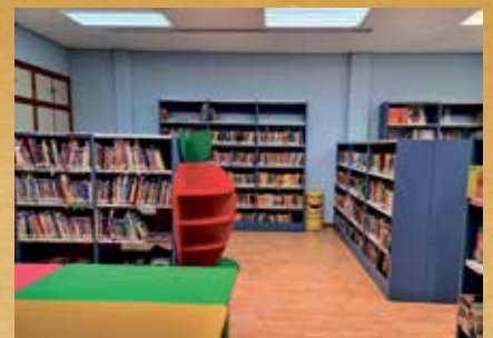
Las tres plantas de la Biblioteca han sido pintadas

Por otro lado, desde el 18 de enero, la Biblioteca Pública Municipal cambió los horarios de apertura por normativa sanitaria, de modo que, hasta nuevo aviso, el servicio abre de lunes a jueves, de 16.00 a 20.00 h, además, los jueves, de forma extraordinaria, se abre de 11,30 a 13.30 h y los viernes, de 16.00 a 18.00 h.