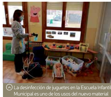
La desinfección de juguetes en la Escuela Infantil Municipal es uno de los usos del nuevo material

como Escuela Infantil (2), Casa Cultura (1), Ludoteca (1), Teatro Municipal (2), Centro Cultural y Juvenil (2), Escuela de Música (3) e instalaciones deportivas (3). Esta es una acción más encaminada a hacer más seguros los espacios de uso público frente a la pandemia, que se suma a otras anteriores.