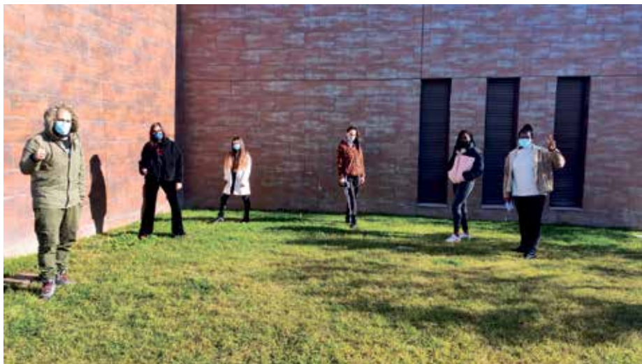
Los ganadores posaron así en el Centro Joven

El concurso convocado por la concejalía de Juventud del Ayuntamiento de Binéfar invitando a los jóvenes a producir y publicar sus videos relacio-