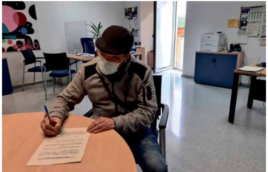
Uno de los autónomos que han concurrido a esta convocatoria durante la firma de la aceptación previa

De los 134.032 euros que suman las 99 ayudas concedidas, 121.057 euros se encuadran en el concepto general (75 por ciento de la cantidad sub-