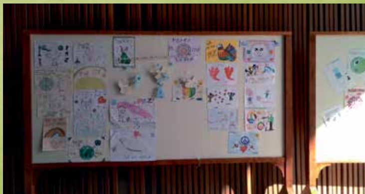
Los niños dejaron sus mensajes de paz para el resto de viandantes