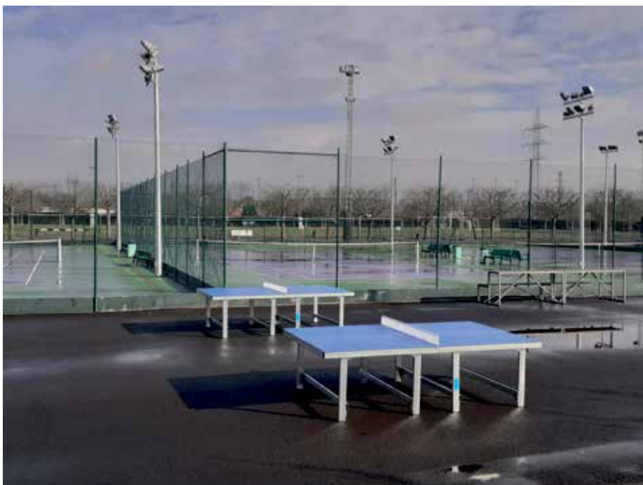
Las mesas de ping pong que se han instalado en Los Olmos

En cuanto a las mesas de ping pong, señalar que solo es preciso llevar el material -raquetas y pelotas-, ya que el uso de las mismas es totalmente libre y gratuito. Se ha aprovechado una zona libre en el área polideportiva para dar la po-