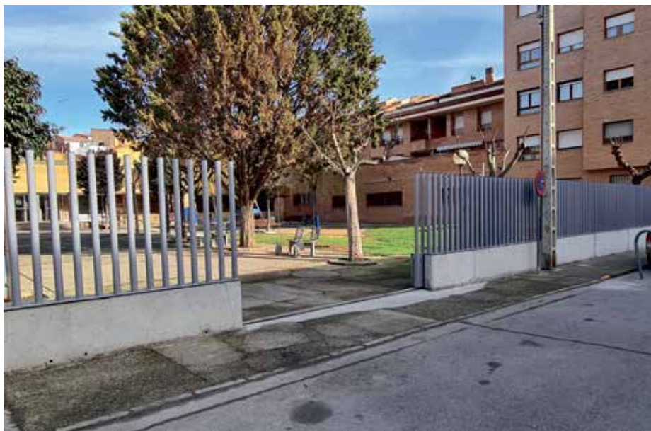
🕒 Vallado del parque frente al Centro de Día del IASS en Binéfar