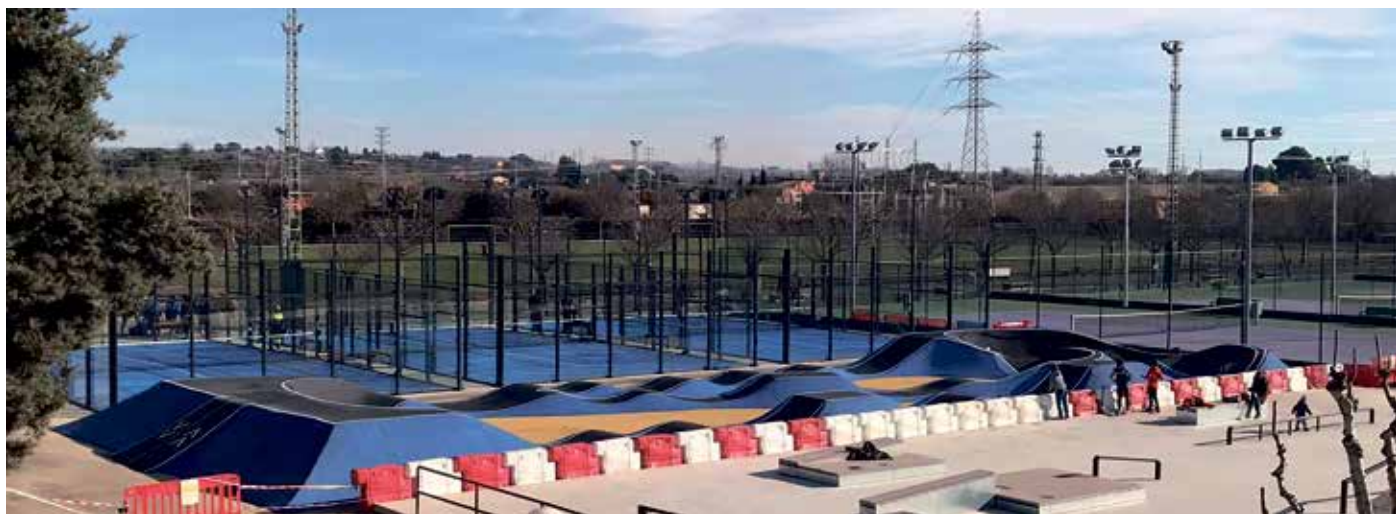
El circuito permanece cerrado hasta que se reparen las deficiencias

La instalación tuvo que ser clausurada al público temporalmente a los tres días de su apertura, ya que aparecieron problemas de construcción que están siendo subsanados